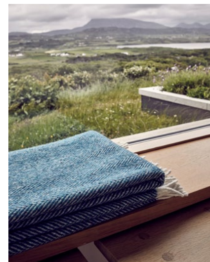
HERDADE (X2) - PAUL MCGUCKIN