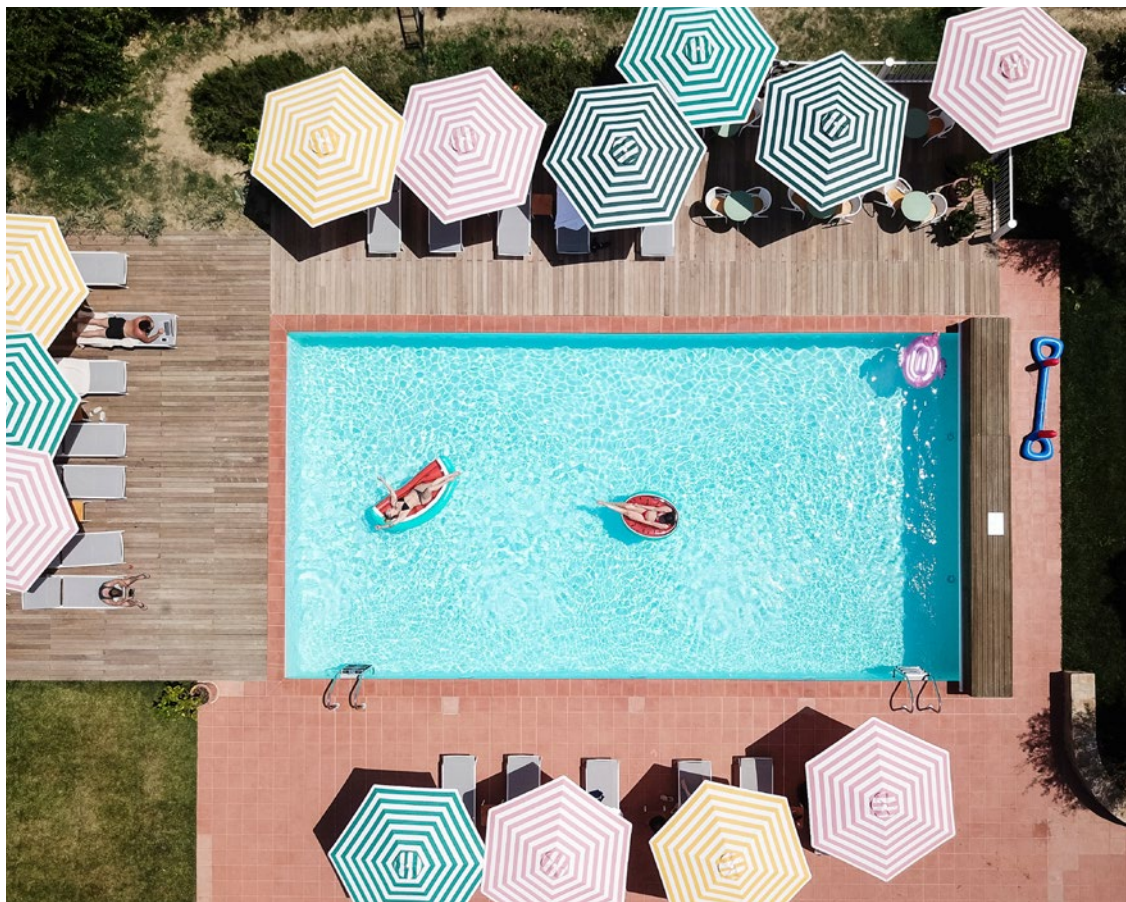
ART DIRECTION VICTOR MELCHIOR OLSSON AND PHOTOGRAPHY HENRIK LUNDELL - DAVID KALIGA/SP

À partir de 220 € la nuit. www.villa-lena.it