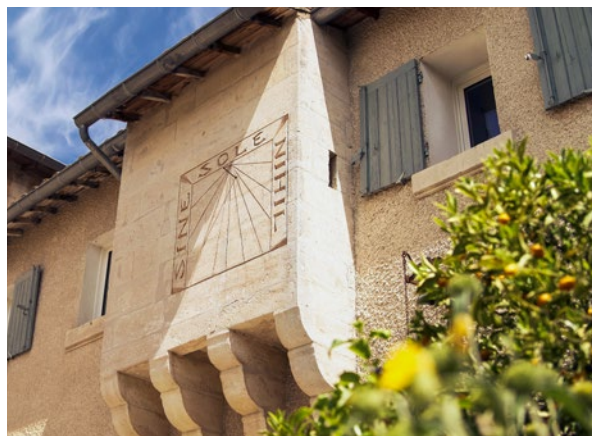
ASPHÉRIES - VIBRANT PHOTOGRAPHY - CHATEAU DU FEÿ (X2)

À partir de 500 € les 3 nuits dans le gîte Terre d'Argence (5 pers.). www.mourguesdugres.com